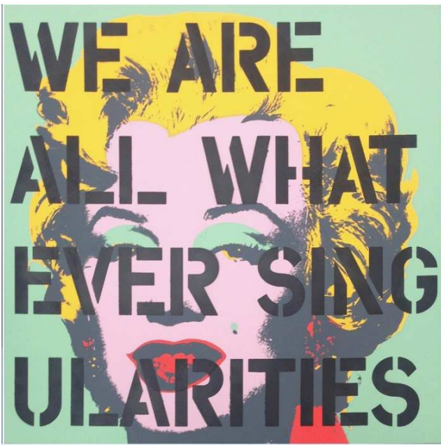
Claire Fontaine, Untitled (We are all whatever singularities) , 2015