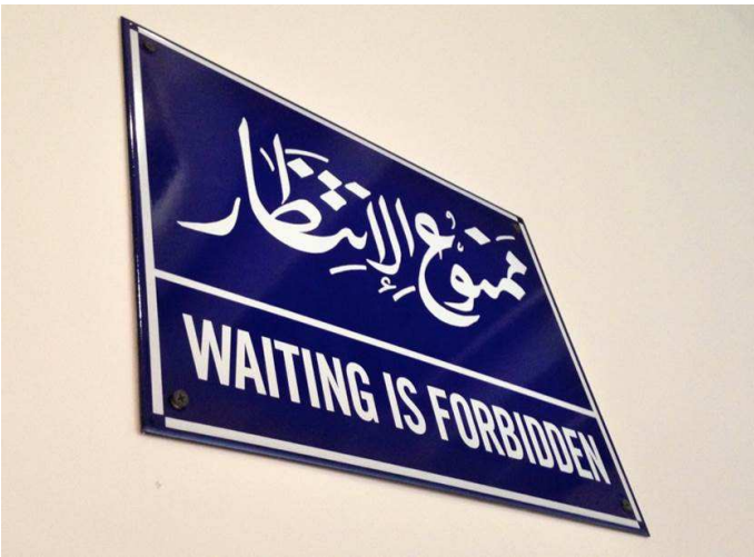
Mona Hatoum, Waiting Is Forbidden , El Cairo, 2006–2008

Martxoaren 22an, asteartea Miércoles 22 de marzo