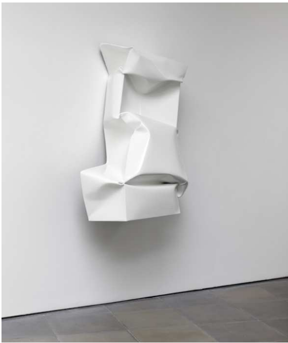
Ángela de la Cruz, Compressed 6 (White) , 2011

Martxoaren 15ean, asteazkena Miércoles 15 de marzo