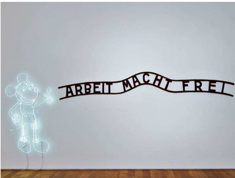
Claude Lévêque, Sans titre (Arbeit macht frei) , 1992

Martxoaren 8an, asteazkena Miércoles 8 de marzo